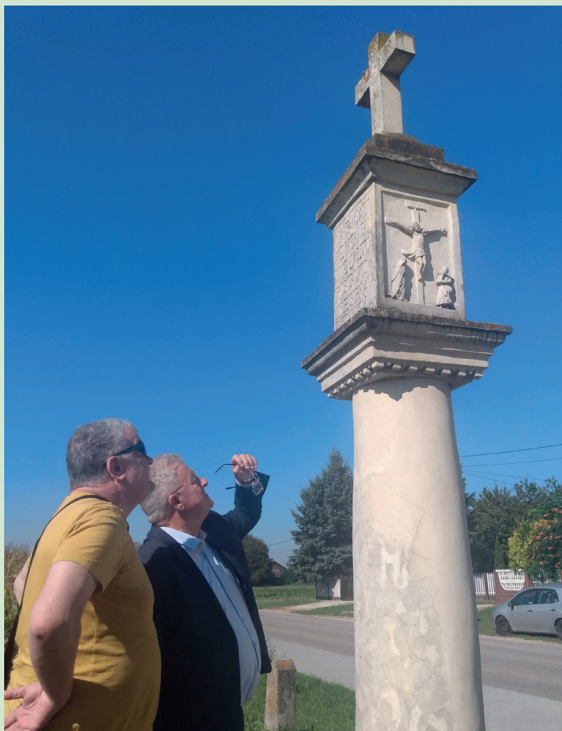
Figurki tego rodzaju nazywane potocznie - topograficzne - wyznaczały kiedyś szlaki handlowe, transportowe i ludzkie, czyli pełniły rolę współczesnych GPS - ów