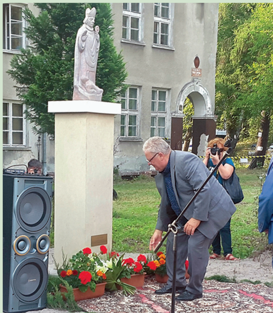
Fundator figurki Świętego Stanisława Biskupa składa kwiaty podczas uroczystości odświeżenia figurki.